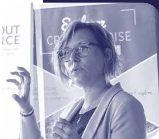
Sandrine English Booster