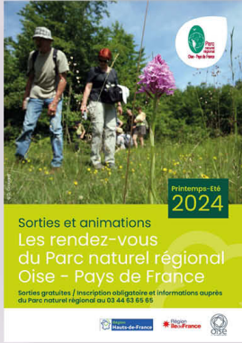
LES RDV NATURE DU PARC NATUREL PRINTEMPS- ÉTÉ 2024