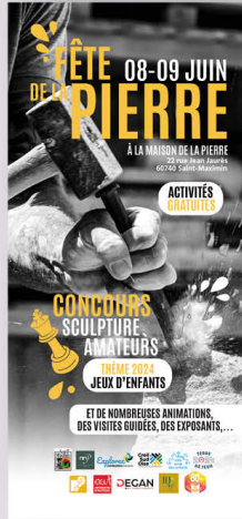
PROGRAMME DE LA FÊTE DE LA PIERRE