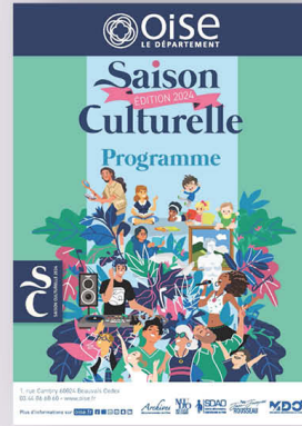
SAISON CULTURELLE DE L'OISE 2024