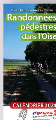
RANDOS DANS L'OISE