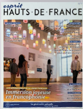
NOUVEAU NUMÉRO !