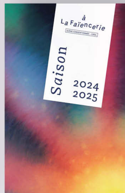
FAÏENCERIE-THÉÂTRE PROGRAMME 24-25