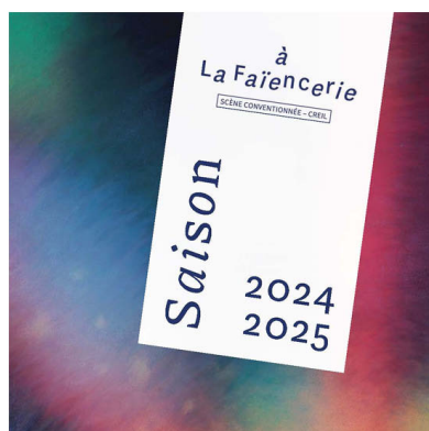
Saison culturelle 24-25 LA FAÏENCERIE-THÉÂTRE À CREIL