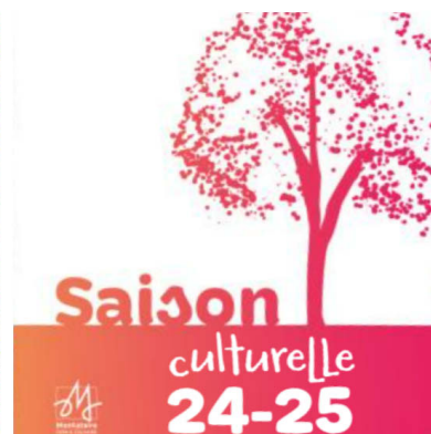
Saison culturelle 24-25 LE PALACE À MONTATAIRE

Découvrez la présentation de la saison culturelle du Palace dans le