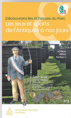
LES SPORTS DE L'ANTIQUITÉ À NOS JOURS